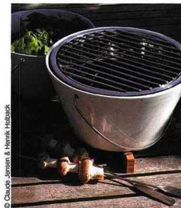
© Charles Jansen & Henrik Holback